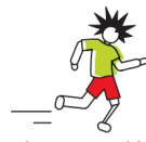
Debout avec prothèse ou orthèse