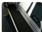
Un hayon arrière facile d'accès pour tous types de fauteuils