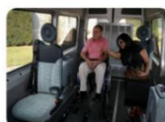
Permettre de placer handi et valides