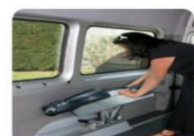
Pratique et rapide pour nos salariés pour éviter tout forçage inutile