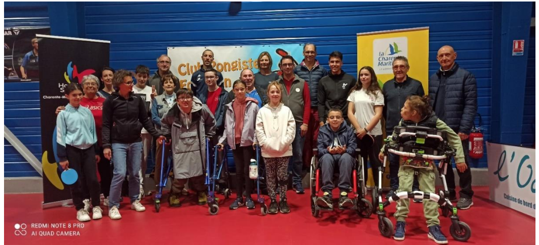
Sortie découverte pour les jeunes 2025

Avec votre aide, nous pourrions continuer à transformer des vies par le sport et à faire grandir le mouvement Handisport dans notre département.