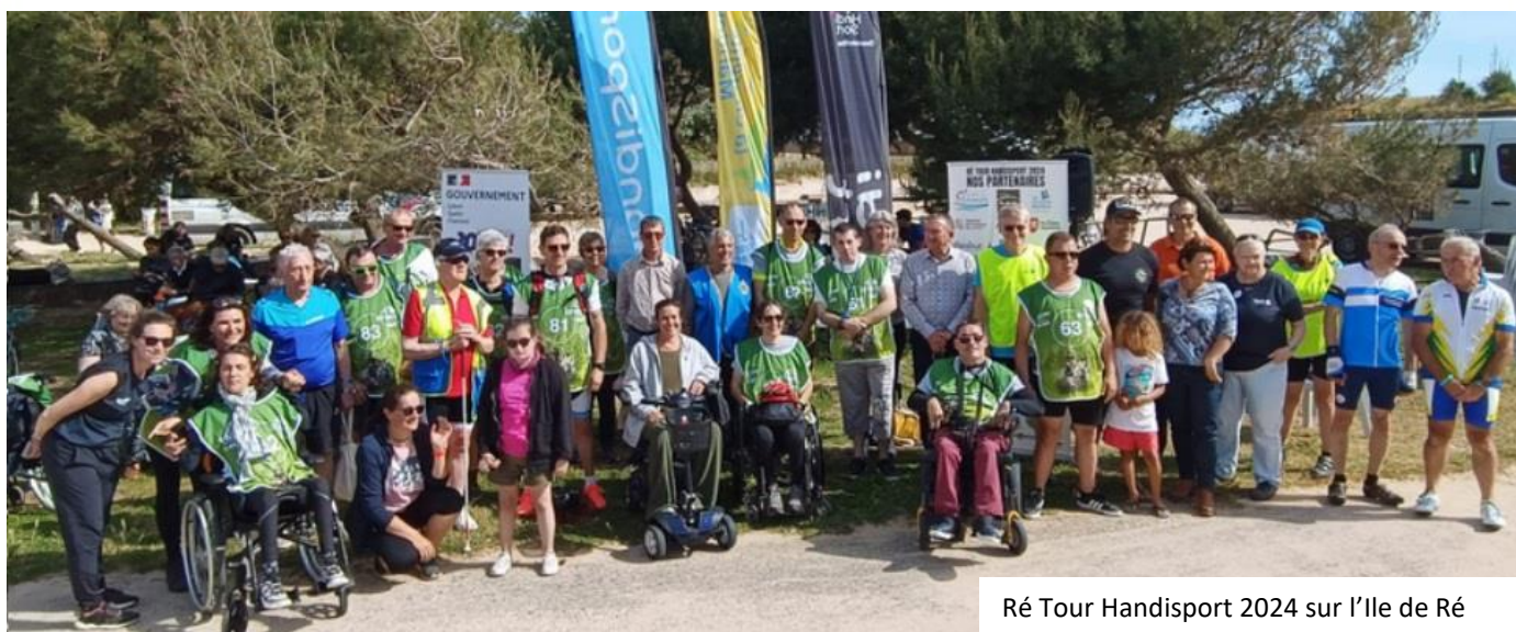
Ré Tour Handisport 2024 sur l'Île de Ré

REJOIGNEZ LE MOUVEMENT HANDISPORT ET NOTRE AVENTURE SOLIDAIRE !