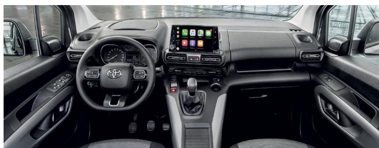
Poste de conduite du TOYOTA

Les 2 véhicules du CDH17 ont un poste de conduite adapté aux personnes en situation de handicap, et le minibus a une rampe pour faciliter l'accès des personnes en fauteuils manuels ou électriques.