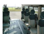
Fixations au sol facilitée (attaches des fauteuils par sangles)