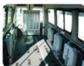
Un grand espace pour déplacer le matériel handisport encombrant