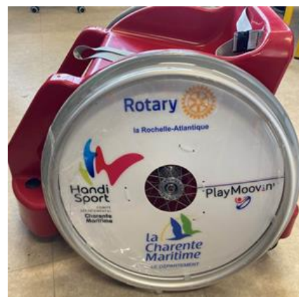
Fauteuil offert en 2025 par le ROTARY CLUB LA ROCHELLE-ATLANTIQUE sur présentation d'un devis.