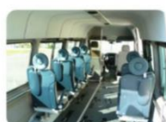
Une ergonomie idéale pour un transport efficace (sièges pliants)