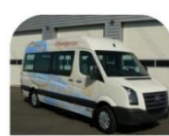
Possibilité de logoter notre minibus avec tous nos sponsors